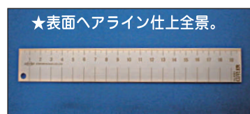
★表面ヘアライン仕上全景。