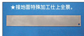
★接地面特殊加工仕上全景。