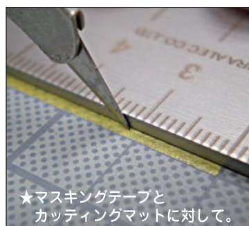
★マスキングテープとカッティングマットに対して。