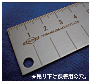
★吊り下げ保管用の穴。