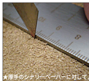
★厚手のシナリーペーパーに対して。