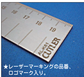
★レーザーマーキングの品番、ロゴマーク入り。