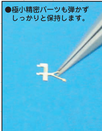
●極小精密パーツも弾かずしっかりと保持します。