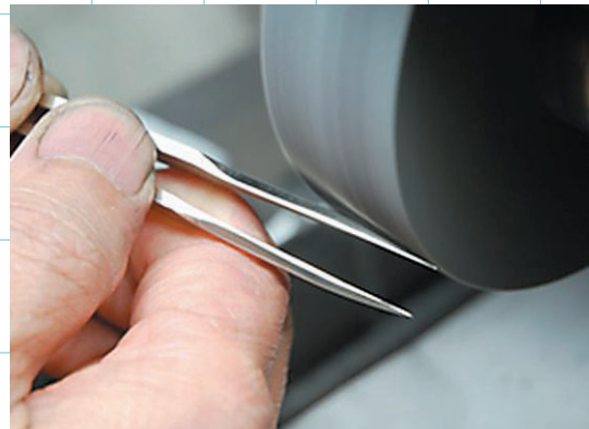
●手作業による先端側面最終仕上げ