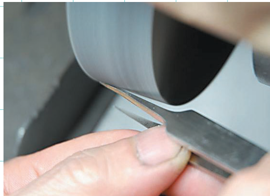
●手作業による先端最終仕上げ