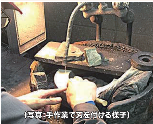
(写真:手作業で刃を付ける様子)

スーパー青鋼とは ① 白紙・青紙・銀紙という名称は、日立金属(株)ができたあがった鋼を区別するために白い紙、青い紙を目印につけました。それが鋼の名前の由来になっています。 ② 高級刃物に使用される鋼です。 ・白紙にクローム(靱性・焼入性に関与)とタンゲステン(耐摩耗性に関与)と炭素の化合物が含まれ、白紙よりも鋼自体の硬度が高く、粘り強さも持っています。しかも磨耗しにくく長切れします。