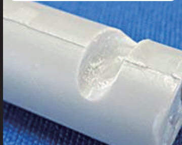
完全硬化レジンの切削