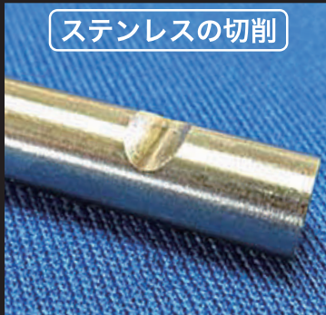
ステンレスの切削