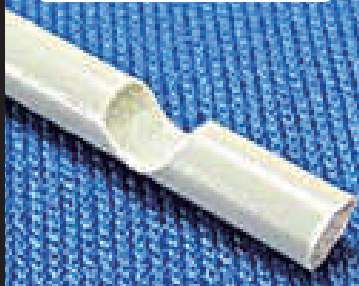
プラスチックの切削