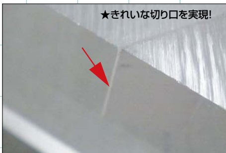
★きれいな切り口を実現!